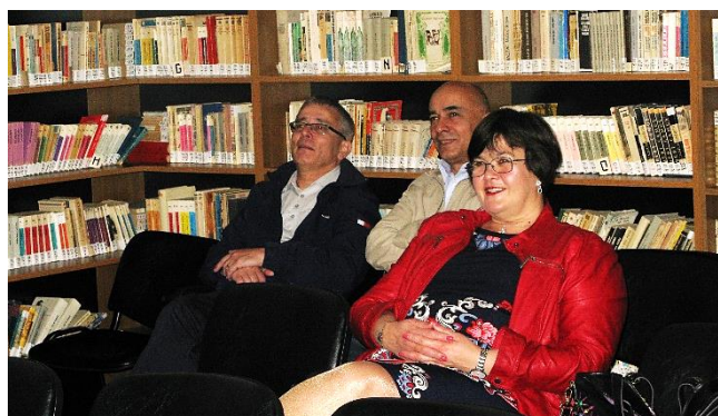
Catedra de matematică C.N.G.L.